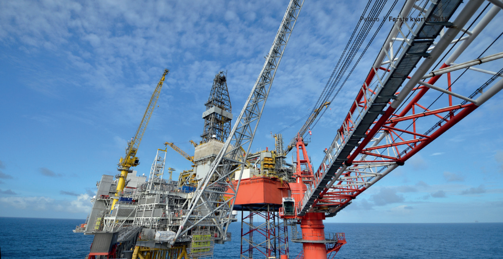
Valemon feltet startet produksjon 3. januar 2015. Petoro er partner med 30 prosent.

8,5 prosent, men økt volum i første kvartal er motvirket av lavere oljepris i norske kroner per fat på 424 kroner mot 670 kroner per fat i samme periode i 2014.